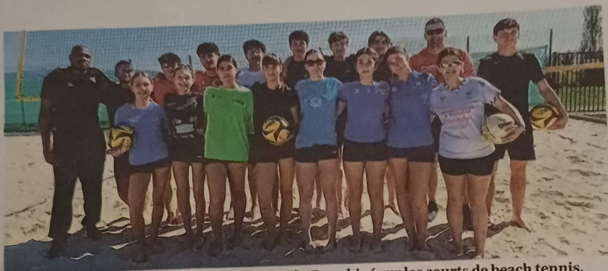
Les élèves de la section volley-ball du lycée du Dauphiné sur les courts de beach tennis.

Tous les mardis, les 18 lycéens inscrits à la section volley-ball du lycée du Dauphiné de Romans prennent la direction des terrains de beach tennis, au complexe sportif des Guinches, à Mours-Saint-Eusèbe, dans le cadre de la préparation d'une rencontre UNSS de beach prévue le 16 avril.